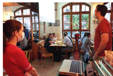
Die Teams zerbrechen sich den Kopf zu Fragen aus Kategorien wie «Weltall» oder «Bilderrätsel».

Wir setzen uns vor der Bar an einen Tisch und mustern die anderen Personen im Raum. Nach und nach füllt sich die Gaststube, und die anderen Teams nehmen Platz. Wir bestellen unsere Getränke. Dabei werden wir nach unserem Gruppennamen gefragt. Wir entscheiden uns für «dead:line». Kaum haben wir angestossen, wird uns ein Bogen mit den Kategorien der Fragen hingelegt: «1920er», «Weltall», «Musik», «Bilderrätsel», «Wer/Was bin ich» und «Random» (Allerlei). Wir wissen nicht so recht, was wir von dieser Auswahl halten sollen. Dem Motto «Allgemeinwissen» werden die Themen jedenfalls gerecht. Wir sind gespannt.